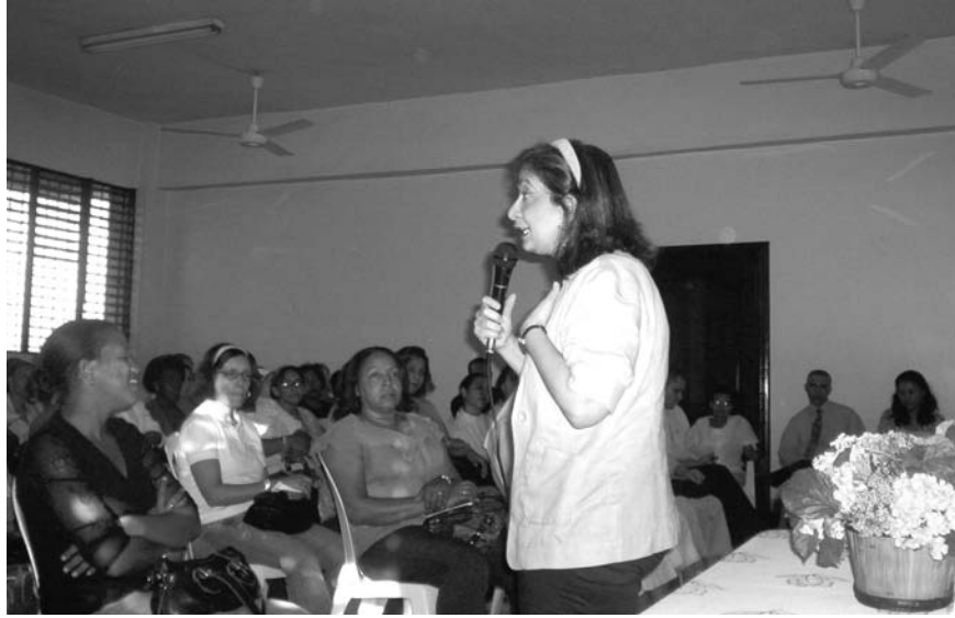
Los planes preventivos y asistenciales que ejecuta esta entidad fundada en el año 1997 procuran evitar y tratar enfermedades.